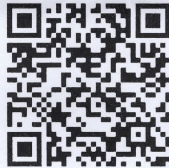
๒. ระบบ iOS

เว็บไซต์สำนักการสอบสวนและนิติการ https://multi.dopa.go.th/ilab/main/web_index หัวข้อข่าวประชาสัมพันธ์