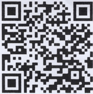
๑. ระบบ Android